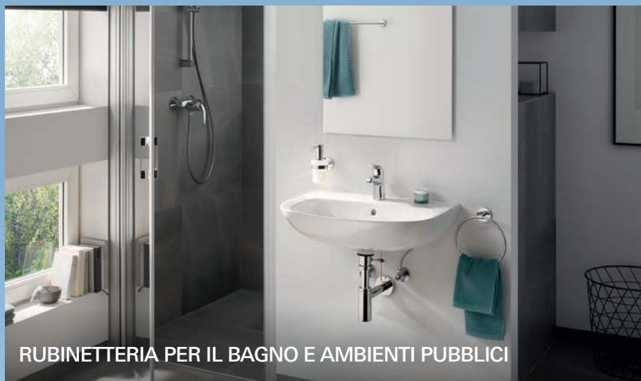
RUBINETTERIA PER IL BAGNO E AMBIENTI PUBBLICI