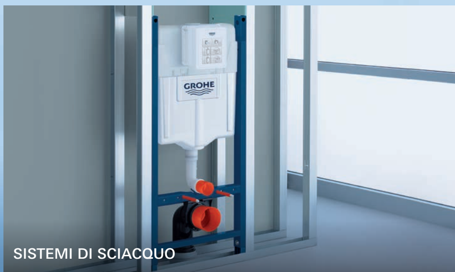
SISTEMI DI SCIACQUO