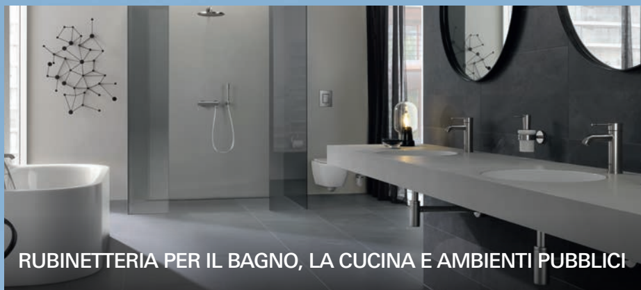
RUBINETTERIA PER IL BAGNO, LA CUCINA E AMBIENTI PUBBLICI