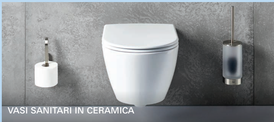
VASI SANITARI IN CERAMICA