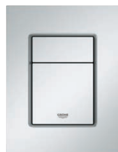
37 535 P00 Chrom mat