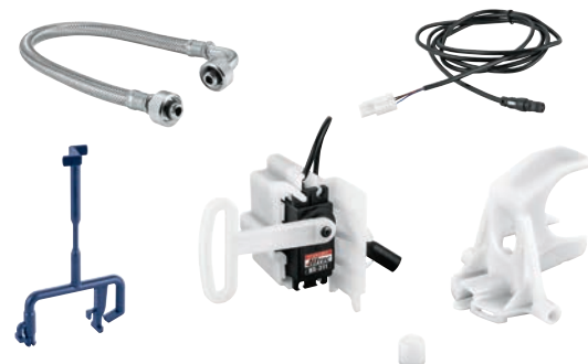
46 944 001 Zestaw do spłukiwania automatycznego

GROHE Rapid SLX to elastyczny i łatwy w instalacji system podtynkowy ze zintegrowanym przyłączem prądu do toalet myjących . Dodatkowo, można zastosować zestaw do automatycznego spłukiwania. Bogaty wybór przycisków spłukujących w różnych kolorach oraz wzorach ułatwia idealne dopasowanie do aranżacji łazienki.