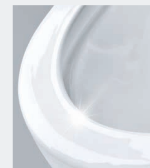
GROHE HYPERCLEAN Antybakteryjna powłoka