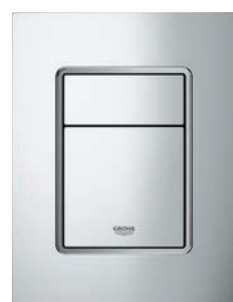
37 535 000 Chrom