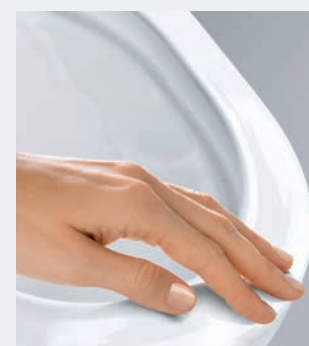
GROHE AQUACERAMIC Hydrofilowa warstwa uniemożliwia przywieranie zanieczyszczeń do powierzchni