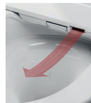
SUSZARKA Delikatne suszenie ciepłym powietrzem dla większego komfortu