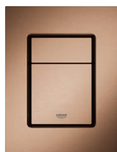
37 535 DL0 Brushed Warm Sunset