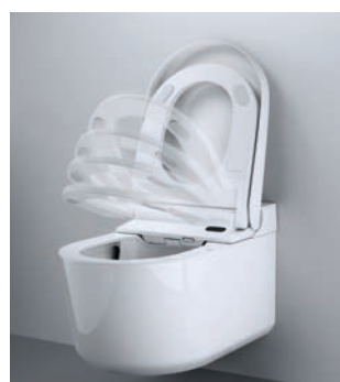
AUTOMATYCZNE OTWIERANIE I ZAMYKANIE POKRYWY I DESKI Funkcja uruchamiana przez czujnik ruchu

Toalety myjące GROHE Sensia mają dodatkowe funkcje zaprojektowane z myślą o osobistym komforcie. Dzięki zintegrowanemu czujnikowi ruchu pokrywa toalety myjącej GROHE Sensia otwiera się i zamyka automatycznie. Podświetlenie nocne zwiększa bezpieczeństwo i komfort korzystania z toalety w nocy, ułatwiając odnalezienie jej w ciemności. Natomiast funkcja suszenia zapewnia uczucie czystości i suchości po skorzystaniu z toalety.