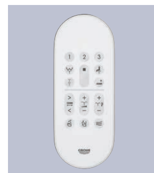
PILOT ZDALNEGO STEROWANIA Szybki dostęp do funkcji toalety