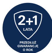
39 354 SH1 Sensia Arena | Toaleta myjąca z pilotem