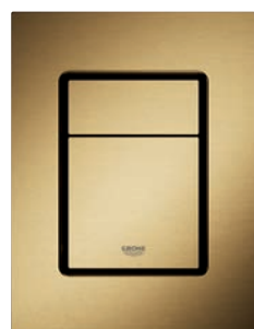
37 535 GN0 Brushed Cool Sunrise