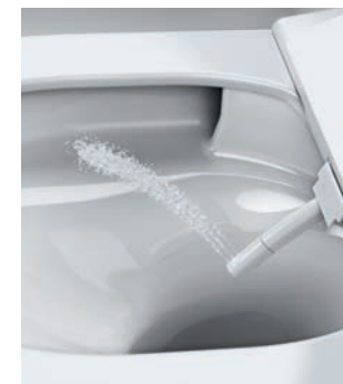
STRUMIEŃ DLA KOBIEC Strumień o innym nachyleniu, specjalnie dla kobiet