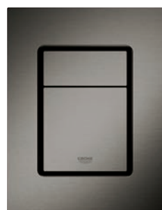
37 535 AL0 Brushed Hard Graphite