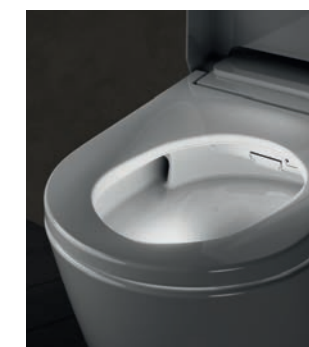
PODŚWIETLENIE NOCNE Automatyczne podświetlenie uruchamiane przez czujnik ruchu