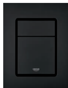
37 535 KF0 Phantom Black