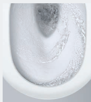
GROHE TRIPLE VORTEX Precyzyjne i ciche spłukiwanie

Dzięki innowacyjnym funkcjom toaleta myjąca pozostaje nieskazitelnie czysta na dłużej. System spłukiwania Triple Vortex tworzy silny wir wody z trzech otworów w muszli, dzięki czemu możliwe jest pokrycie całej jej powierzchni wodną powłoką oraz precyzyjne, kompleksowe oczyszczenie. Powierzchnia GROHE AquaCeramic pomaga zapobiegać nieestetycznemu osadzeniu się kamienia i zanieczyszczeń na ceramice. Z kolei zastosowana powłoka HyperClean ma właściwości antybakteryjne.