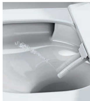
PODWÓJNE RAMIĘ PRYSZNICOWE Dokładniejsze mycie

Toalety myjące GROHE Sensia wyposażone są w podwójne ramiona prysznicowe, które zapewniają higienę dostosowaną do potrzeb. Strumień tylny dokładnie oczyszcza skórę i pozostawia uczucie świeżości. Strumień dla kobiet jest szerszy i delikatniejszy, zapewnia doskonałą higienę okolic intymnych. Antybakteryjne i samooczyszczające się ramiona prysznicowe gwarantują czystość produktu przy każdym użyciu.