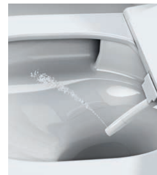
STRUMIEŃ TYLNY Regulowany strumień do delikatnego mycia