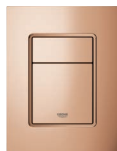
37 535 DA0 Warm Sunset