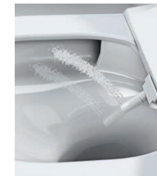
STRUMIEŃ OSCYLACYJNY Oscylacyjny ruch ramienia oczyszcza większą powierzchnię ciała