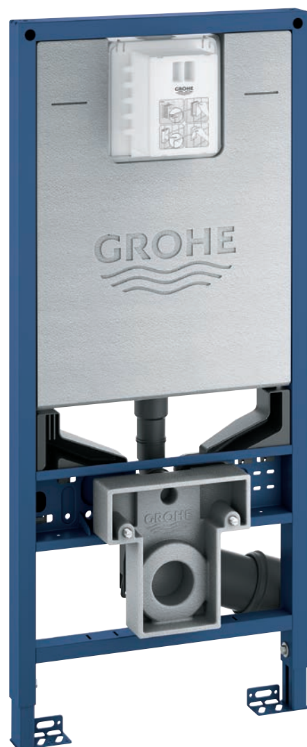
39 596 000 Rapid SLX Stelaż podtynkowy