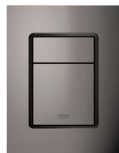
37 535 A00 Hard Graphite