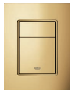
37 535 GL0 Cool Sunrise