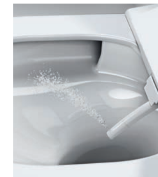
STRUMIEŃ MASUJĄCY Strumień zapewniający efekt masażu