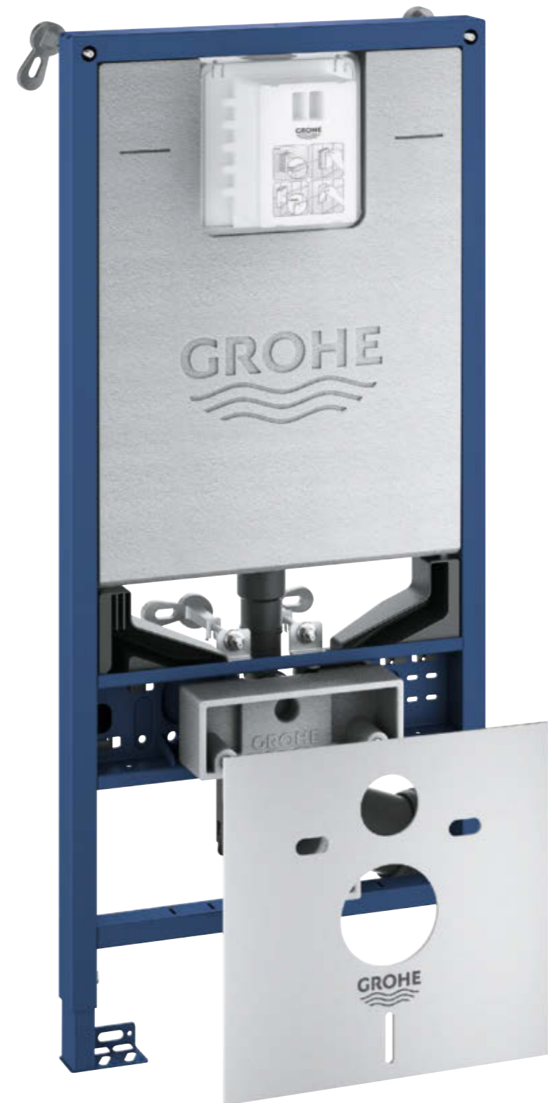
39 598 000 Rapid SLX 3-in-1 WC 6 | 1,13 m met wandhoeken en geluidsbescherming

ervoor zorgen dat je precies de opstelling krijgt die je nodig hebt, zodat je uiteindelijk tijd en geld bespaart en vanaf het begin een volledige klanttevredenheid kunt leveren.