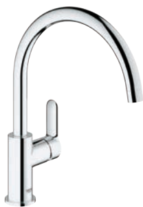
31 369 000 Mitigeur évier Bec haut

GROHE Start Edge présente un design équilibré et harmonieux en cuisine. Son levier en forme de losange est agréable à utiliser tout en offrant un style sophistiqué.