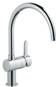
32 452 000 Mitigeur évier Bec haut

Ses différents becs permettent de remplir sans aucune difficulté les marmites les plus hautes. Disponible avec un mousseur extractible 2 jets qui permet de diriger le jet d'eau selon vos besoins. La technologie supérieure GROHE SilkMove® garantit un fonctionnement impeccable et la finition GROHE StarLight®, une brillance éclatante pendant de nombreuses années.