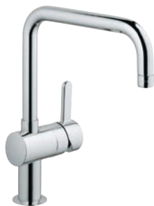
32 453 000 Mitigeur évier Bec haut