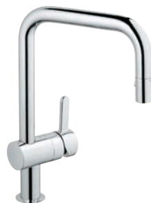
32 455 000 Mitigeur évier Bec haut Mousseur extractible 2 jets