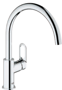
31 374 000 Mitigeur évier Bec haut

Une étonnante simplicité définit GROHE Start Loop. Son levier en forme de boucle rend la manipulation et la prise en main extrêmement faciles. Son bec cylindrique apporte finesse et légèreté tout en conservant les performances recherchées dans les cuisines actuelles .