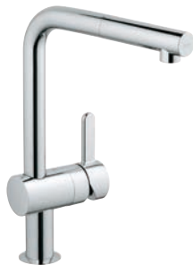
32 454 000 Mitigeur évier Bec haut Mousseur extractible