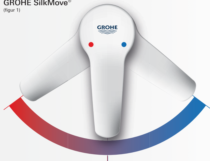
GROHE SilkMove® (figur 1)