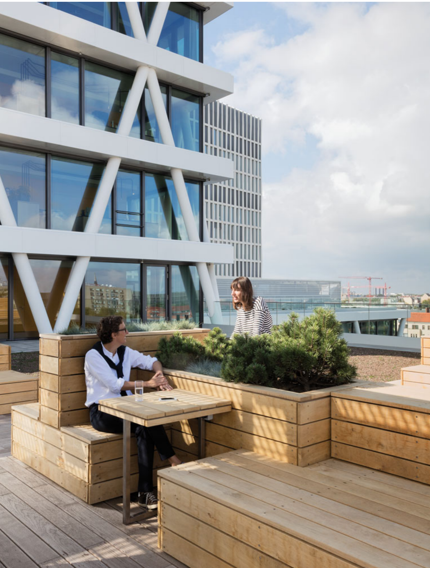
Die Sachlichkeit normaler Bürowelten durchbrechen: Kern des Gebäudekonzeptes sind die individuellen, veränderbaren Arbeitswelten. Ein zentrales Element dafür sind die übers gesamte Gebäude verstreuten Balkone als Outdoor-Workspaces.