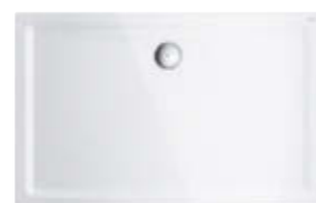
39 307 000 Acryl-Duschwanne | 90 cm x 140 cm