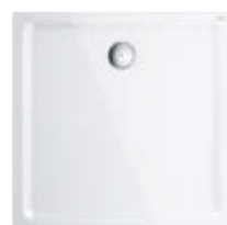
39 300 000 Acryl-Duschwanne | 100 cm x 100 cm 39 301 000 Acryl-Duschwanne | 90 cm x 90 cm 39 302 000 Acryl-Duschwanne | 80 cm x 80 cm