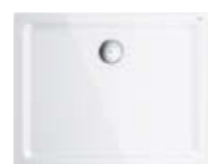
39 306 000 Acryl-Duschwanne | 80 cm x 100 cm