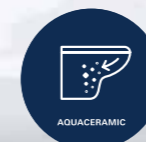
HyperClean Glasur wirkt antibakteriell Aquaceramic Schmutz- und kalkabweisende Oberfläche