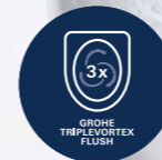
Triple Vortex Spülung