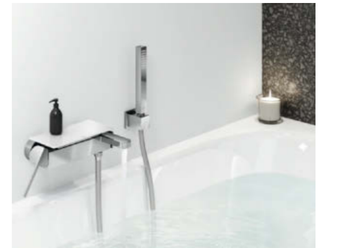
33 547 003 + 40 954 000 خلط استحمام مع مجموعة استحمام + صينية