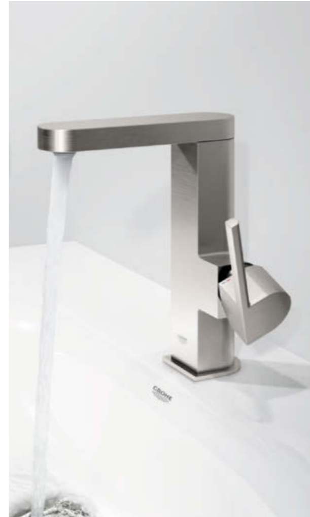
32 612 00 خلط حوض حجم صغير مع مجموعة النفايات