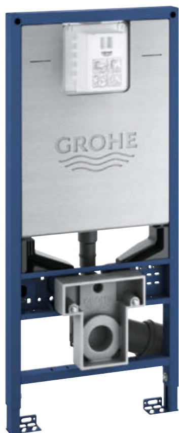
39 596 000 Rapid SLX WC 3-6 | 1.13 m, standardowy Stelaż podtynkowy Rapid SLX, wysokość zabudowy 1,13 m, zbiornik sflukujący GD2, przyłącze elektryczne, regulator przepływu wody, łatwy dostęp oraz zabezpieczenie przed kondensacją pary wodnej.

zapewnić dokładnie taką konfigurację, jakiej potrzebujesz. Oszczędzasz w ten sposób czas i pieniądze oraz zyskujesz gwarancję satysfakcji klienta już od samego początku.