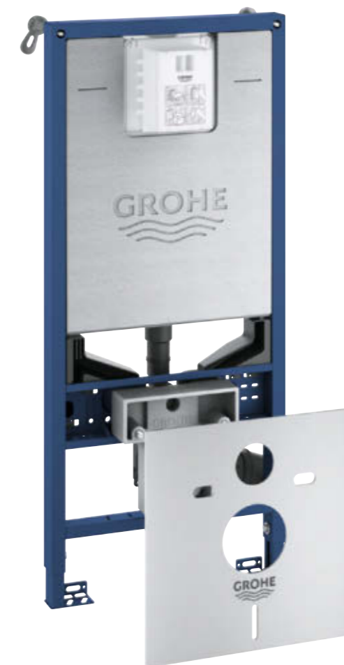
39 598 000 Rapid SLX 3in1 WC 6 | 1.13 m z uchwytemi ściennymi i matą wyciszającą Stelaż podtynkowy Rapid SLX, wysokość zabudowy ze zbiornikiem sflukującym GD2 1,13 m, przyłącze elektryczne, regulator przepływu wody, łatwy dostęp przyłącze elektryczne, przed kondensacją pary wodnej. Z uchwytemi ściennymi i matą wyciszającą.