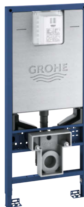
39 597 000 Rapid SLX WC 3-6 | 1.13 m, bez rury odpływowej Stelaż podtynkowy Rapid SLX, wysokość zabudowy ze zbiornikiem sflukującym GD2 1,13 m, przyłącze elektryczne, regulator przepływu wody, łatwy dostęp oraz zabezpieczenie przed kondensacją pary wodnej. Bez rury odpływowej.