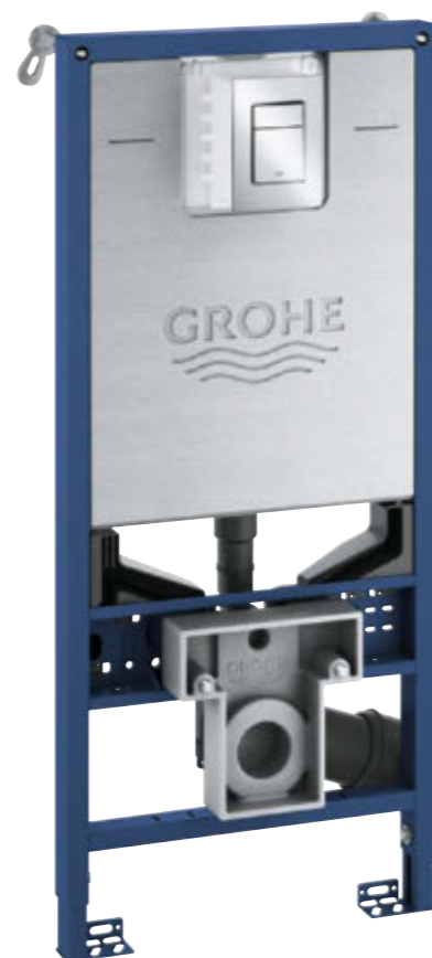
39 603 000 Rapid SLX WC 3-6 | 1.13 m z uchwytemi ściennymi i Skate Cosmopolitan S Chrome Stelaż podtynkowy Rapid SLX, wysokość zabudowy ze spluczką GD2 1,13 m, przyłącze elektryczne, regulator przepływu wody, łatwy dostęp oraz zabezpieczenie przed kondensacją pary wodnej. Z uchwytemi ściennymi i chromowanym przyciskiem sflukującym Skate Cosmopolitan S.