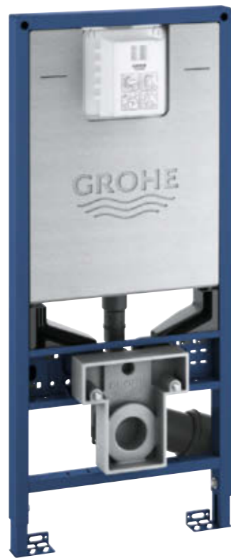
39 596 000 Rapid SLX WC 3-6 | 1,13 m, Standaard Rapid SLX-element voor wc's met een montagehoogte van 1,13 m, GD2-spoelreservoir, geïntegreerde 230 V aansluiting, flow manager, makkelijke toegang en volledige isolatie tegen condensvorming.

ervoor zorgt dat je precies de opstelling krijgt die je nodig hebt, zodat je uiteindelijk tijd en geld bespaart en vanaf het begin een volledige klanttevredenheid kunt leveren.