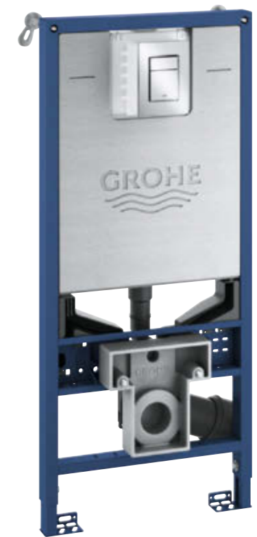
39 603 000 Rapid SLX WC 3-6 | 1,13 m, met wandbevestigingsset en Skate Cosmopolitan S chroom Rapid SLX-element voor wc's met een montagehoogte van 1,13 m, GD2-spoelreservoir, geïntegreerde 230 V aansluiting, flow manager, makkelijke toegang en volledige isolatie tegen condensvorming. Met wandbevestigingsset en Skate Cosmopolitan S-bedieningsplaat (chrom).