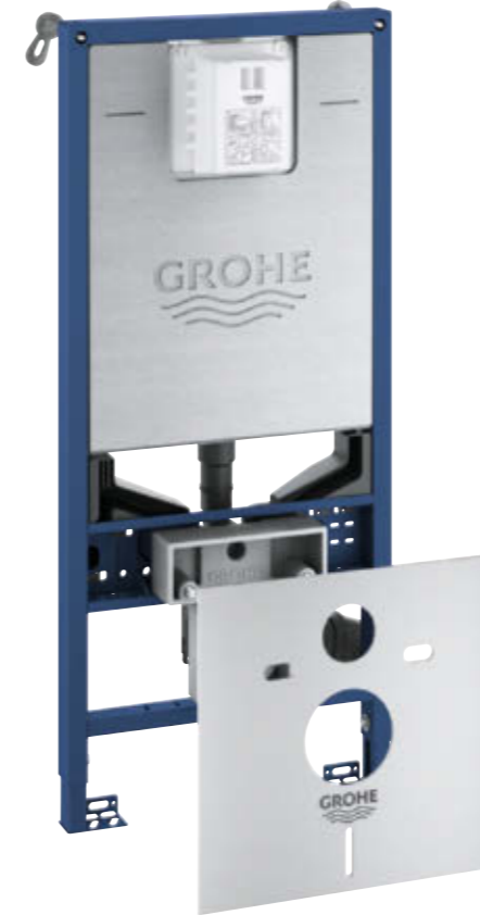
39 598 000 Rapid SLX 3-in-1 WC 6 | 1,13 m, met wandbevestigingsset en geluidsbescherming Rapid SLX-element voor wc's met een montagehoogte van 1,13 m, GD2-spoelreservoir, geïntegreerde 230 V aansluiting, flow manager, makkelijke toegang en volledige isolatie tegen condensvorming. Met wandbevestigingsset en geluidsbescherming.