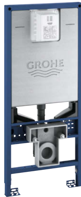
39 597 000 Rapid SLX WC 3-6 | 1,13 m, zonder afvoerpijp Rapid SLX-element voor wc's met een montagehoogte van 1,13 m, GD2-spoelreservoir, geïntegreerde 230 V aansluiting, flow manager, makkelijke toegang en volledige isolatie tegen condensvorming. Zonder afvoerpijp.