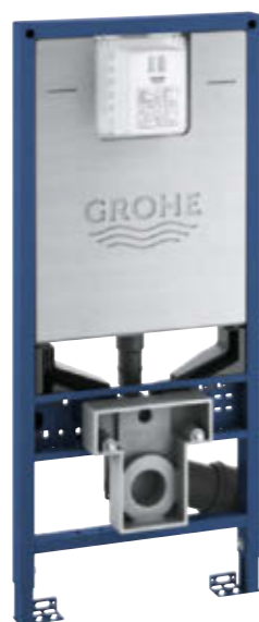
39 596 000 Rapid SLX WC 3-6 | 1,13 m, estándar Módulo Rapid SLX para inodoro, altura de instalación de 1,13 m con cisterna de descarga GD2, enchufe eléctrico, control de flujo, acceso sencillo y totalmente aislado frente a la condensación.

garantizando que encuentres la configuración que necesitas y permitiéndote ahorrar tiempo y dinero, ofreciendo así una satisfacción absoluta desde el principio.