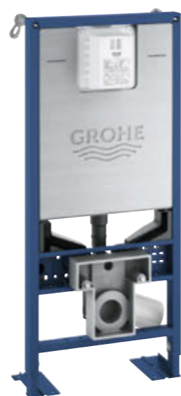
39 599 000 Rapid SLX WC 3-6 | 1,13 m F, con patas para carga pesada Módulo Rapid SLX para inodoro, altura de instalación de 1,13 m con cisterna de descarga GD2, enchufe eléctrico, control de flujo, acceso sencillo y totalmente aislado frente a la condensación. Con patas para carga pesada.