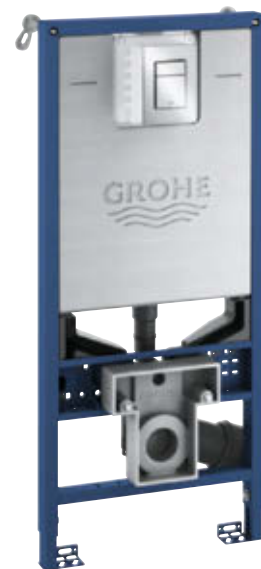
39 603 000 Rapid SLX für WC 3-6 | 1,13 m mit Zubehör für Vorwandmontage mit Abdeckplatte Skate Cosmopolitan S Rapid SLX Element für das WC, 1,13 m Montagehöhe mit Spülkasten GD2, mit Elektroanschlussbuchse, einschließlich Spül-Manager, Revisionsöffnung und vollständig isoliert gegen Kondenswasser. Mit Wandwinkeln und Betätigungsplatte Skate Cosmopolitan S (Chrom).