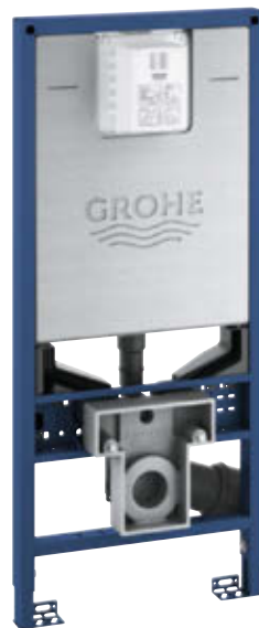
39 596 000 Rapid SLX für WC 3-6 | 1,13 m Rapid SLX Element für das WC, 1,13 m Montagehöhe mit Spülkasten GD2, mit Elektroanschlussbuchse, einschließlich Spül-Manager, Revisionsöffnung und vollständig isoliert gegen Kondenswasser.

Möglichkeiten. Sie sparen Zeit und Geld und der Kunde ist zufrieden.