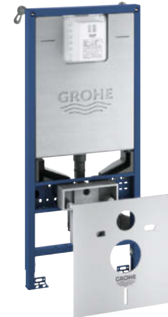
39 598 000 Rapid SLX 3 in 1 Set für WC 6 | 1,13 m mit Zubehör für Vorwandmontage mit WC-Schallschutzset Rapid SLX Element für das WC, 1,13 m Montagehöhe mit Spülkasten GD2, mit Elektroanschlussbuchse, einschließlich Spül-Manager, Revisionsöffnung und vollständig isoliert gegen Kondenswasser. Mit Wandwinkeln und Geräuschschutz.