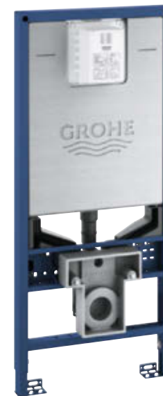
39 597 000 Rapid SLX für WC 3-6 | 1,13 m, ohne Abflussrohr Rapid SLX Element für das WC, 1,13 m Montagehöhe mit Spülkasten GD2, mit Elektroanschlussbuchse, einschließlich Spül-Manager, Revisionsöffnung und vollständig isoliert gegen Kondenswasser. Ohne Abflussrohr.