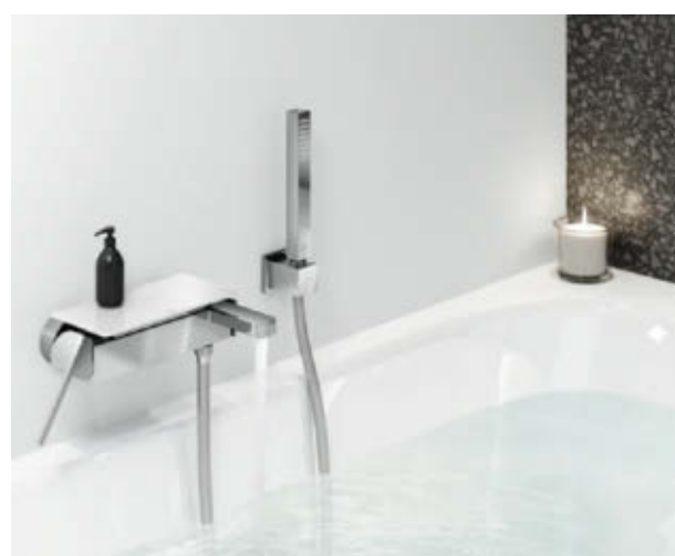
33 547 003 + 40 954 000 Mitigeur douche avec ensemble de douche + plaque