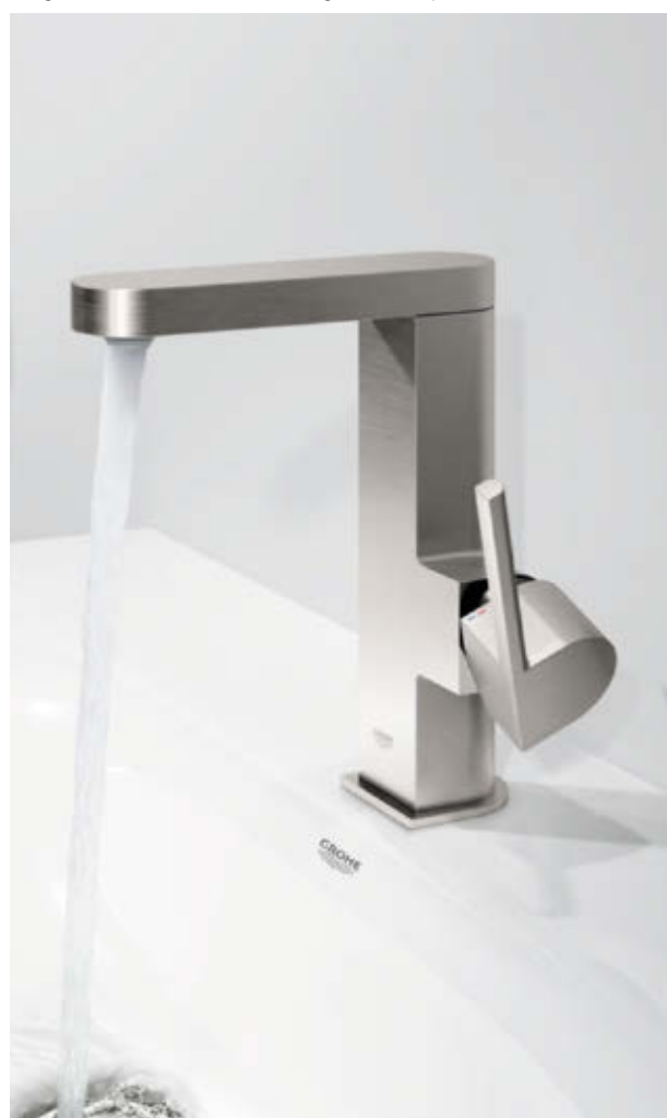
32 612 003 Mitigeur de lavabo Taille S avec vidage automatique