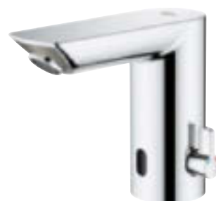
36 453 000 Mitigeur de lavabo infrarouge (avec transformateur 100 – 230 V CA) avec mitigeur