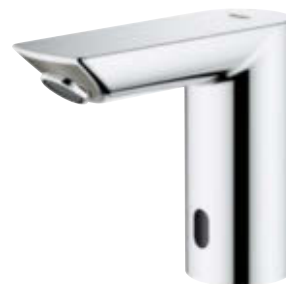
36 452 000 Robinet de lavabo infrarouge (fonctionnement sur pile)