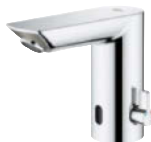
36 451 000 Mitigeur de lavabo infrarouge (fonctionnement sur pile) avec mitigeur

Un système électronique unique et économe en énergie, qui garantit une longue durée de vie.