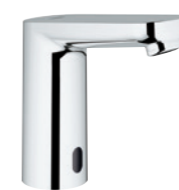
36 330 001 Taille M Mitigeur de lavabo infrarouge alimentation sur pile avec mitigeur caché et limiteur de température ajustable