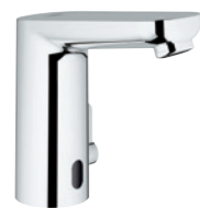
36 327 001 Taille M Mitigeur de lavabo infrarouge alimentation sur pile avec mitigeur et limiteur de température ajustable 36 325 001 avec transformateur 100 – 230 V AC