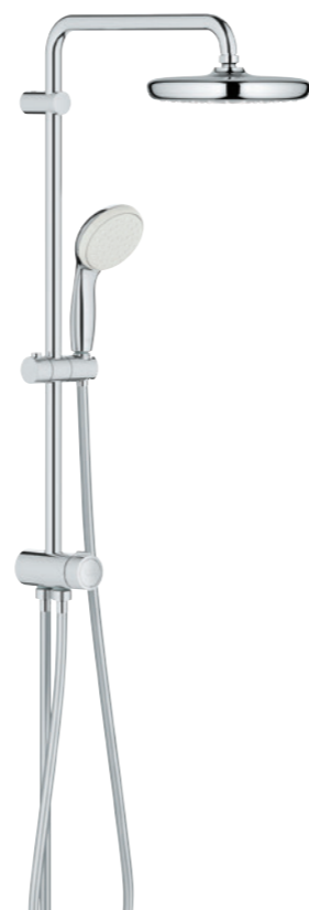
26 381 001 Tempesta System 210 Colonne de douche avec inverseur manuel