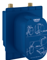
36 339 001 Set de pré-montage avec mitigeur, compatible avec: 36 315 000, 36 412 000, 36 376 000 36 337 001 Set de pré-montage, montage encastré, compatible avec: 36 410 000, 36 334 SD0, 36 335 SD0, 36 273 000 36 336 001 Set de pré-montage avec mitigeur thermostatique pré-réglage et invisible, compatible avec: 36 410 000, 36 334 SD0, 36 335 SD0, 36 273 000