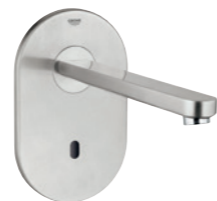
36 334 SD0 Robinetterie infrarouge pour lavabo à montage mural sans mitigeur saillie de 232 mm 36 335 SD0 saillie de 170 mm