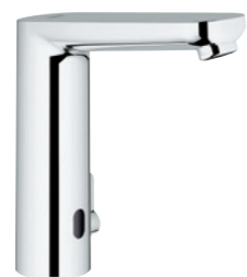
36 422 000 Taille L Mitigeur de lavabo infrarouge alimentation sur pile avec mitigeur et limiteur de température ajustable 36 421 000 avec transformateur 100 – 230 V AC