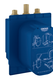
36 458 000 Corps encastré pour douche alimentation sur pile avec mitigeur thermostatique intégré convient pour l'infrarouge 36 456 000