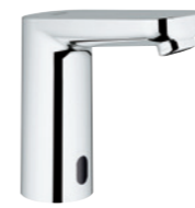
36 439 000 Taille M Robinet lavabo infrarouge alimentation sur pile monofluide