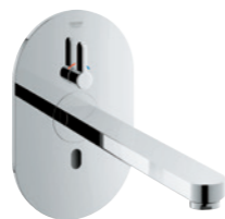
36 376 000 Mitigeur de lavabo infrarouge avec mitigeur et limiteur de température ajustable saillie de 232 mm 36 315 000 saillie de 172 mm